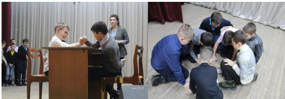
На фото мальчишки 3-го и 4-го классов ГБОУ СОШ пос. Новоспасский