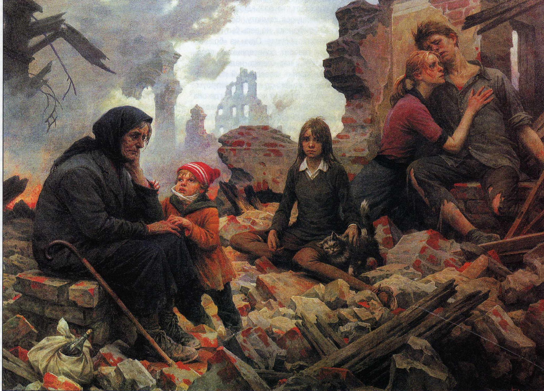
Б.В.Щербаков. Зло мира. Век XX. 1986