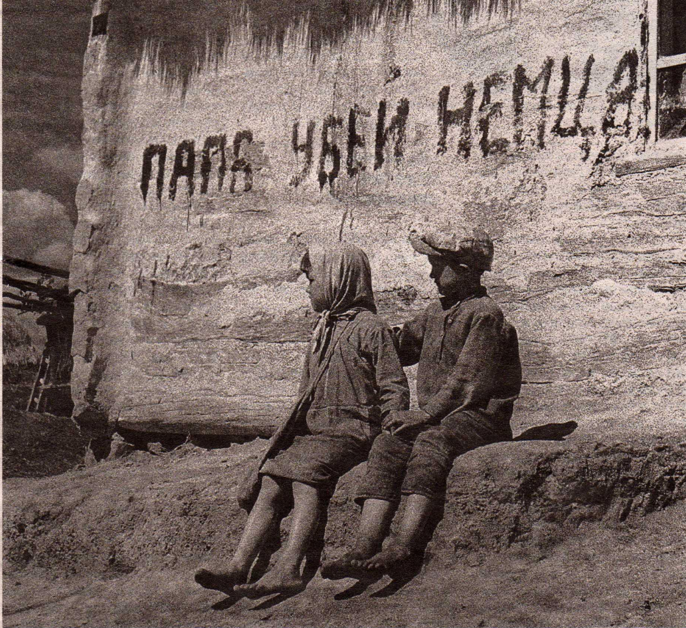
Такие надписи, сделанные детской рукой, очень часто встречались на домах в освобождённых сёлах Снято 25 июня 1943 года.