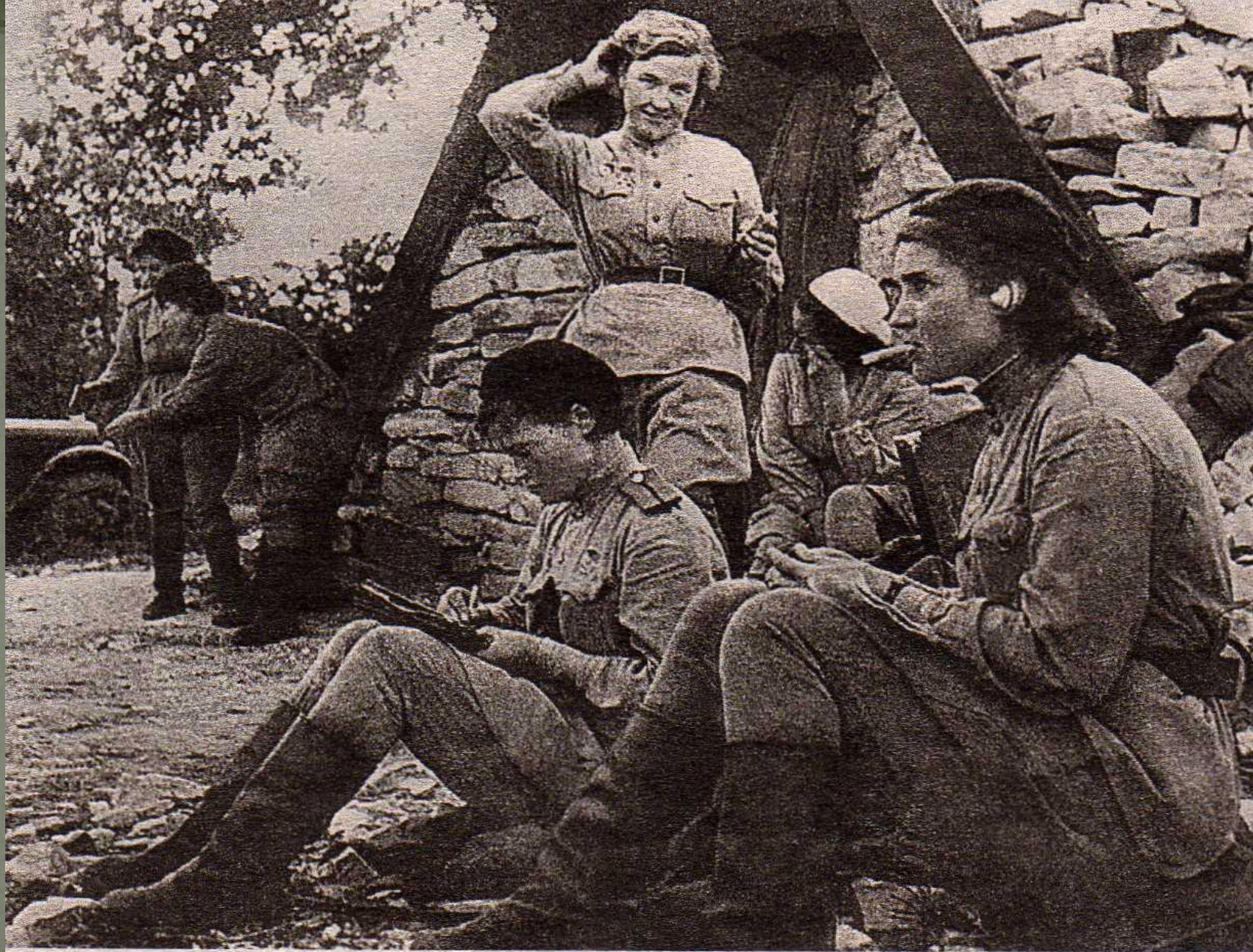
1941 г. Лётчицы - герои ещё не знают, что впереди 4 года страшной войны.