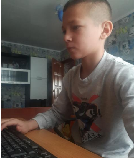
Учащиеся 8 класса – участники Всероссийского открытого урока «ПРОЕКТОРИЯ».