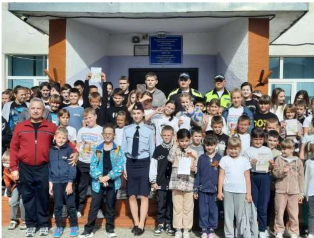
Наша Школьная семья – 2024

классов, ждём от него ещё много доброго, полезного, позитивного и непременно интересного.