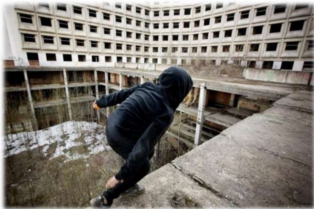
Фото и видео материалы, подтверждающие пребывание в заброшенных зданиях, стройках, лагерях и других объектах